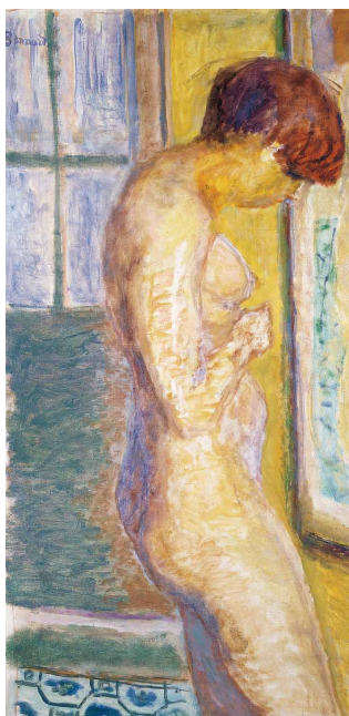
Nu de profil , vers 1917 musée Bonnard, Le Cannet, acquis avec l'aide du Fonds du patrimoine et du FRAM, 2010 © Adago, Paris 2011