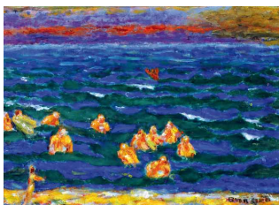
Baigneurs à la fin du jour , vers 1945 musée Bonnard, Le Cannet, acquis avec l'aide du Fonds du patrimoine, 2008 © Adago, Paris 2011 © Yves Inchiernan