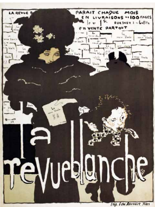
La Revue blanche , 1894 Musée Bonnard