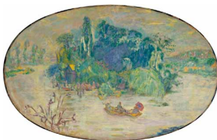
l'île Heureuse , vers 1921 prêt exceptionnel du musée d'Orsay, Paris, ancienne collection Natanson © Adago, Paris 2011 © RMN (musée d'Orsay) / Hervé Lewandowski