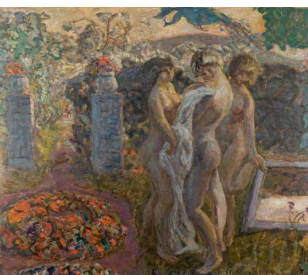
Les Trois Grâces ou Le Paon , 1908 collection privée, prêtée par l'intermédiaire de la galerie Bernheim-Jeune, Paris