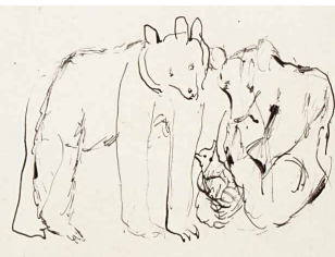
Étude pour Les Histoires du Petit Renard de Léopold Chauveau, Famille d'ours , 1927 musée Bonnard, Le Cannet, dépôt d'une collection privée, 2011 © Adago, Paris 2011